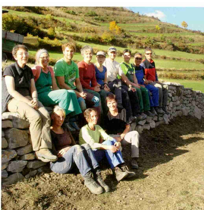
La funcziun ecologica dals mürs sechs es da grond'importanza.

Perquai cha'l savair construir mürs sechs va al main spordschan las organisaziuns da la natüra cuors. Dürant ün'eivna (o eir plü lösch) as poja imprendere a far mürs sechs. La Pro Natura tschercha ils voluntaris e la SUS (Stiftung Umwelteinsatz Schweiz) maina quists cuors intant cha la Fundaziun Pro Terra Engiadina organischa ils lös da construcziun dals mürs e las pernottaziuns dals voluntaris.