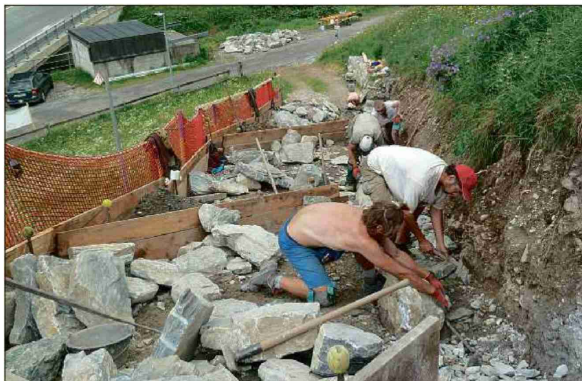
Vista da suringìo vers la via chantunala chi passa in Samignun suot la fracziun Laret oura.