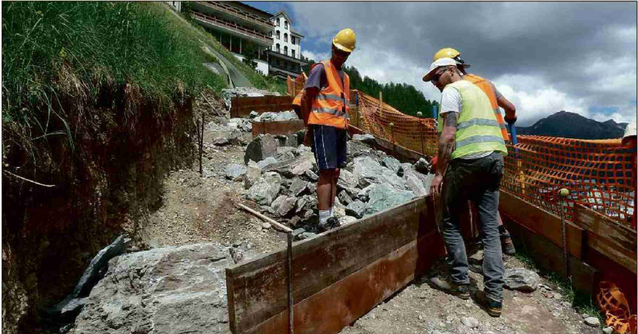
Suot Laret in Samignun ston ils homens dal servezzan civil impedir cha la crappa roudla giò da la costa.

Referenz: 69903911 Ausschnitt Seite: 3/5