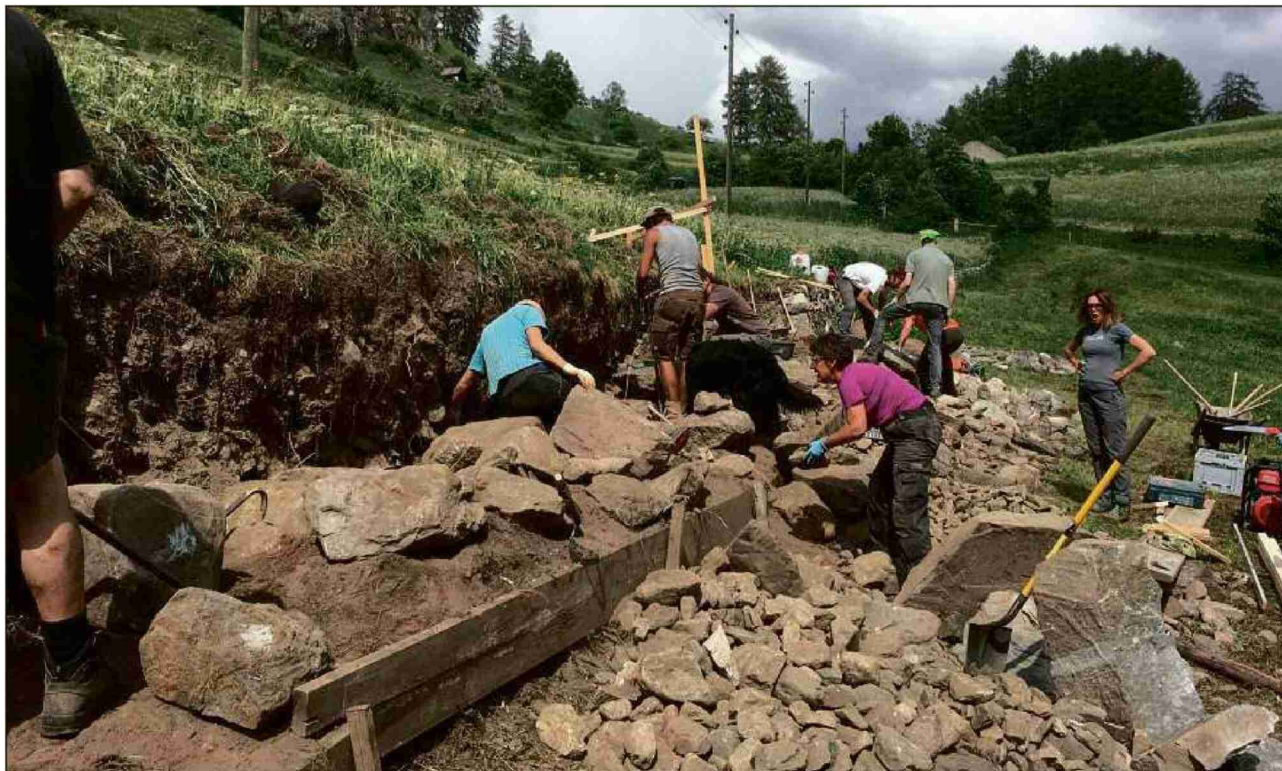
La basa dal mür mort ad Ardez han las partecipantas e'ls partecipants fat cun craps plü gronds e pesants.