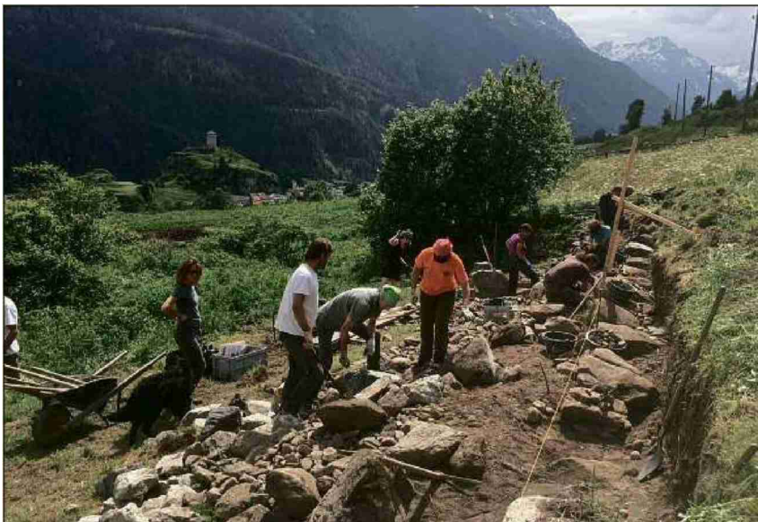
Il piazzal da lavur es sur il cumün d'Ardez in vicinanza da Chanoua.