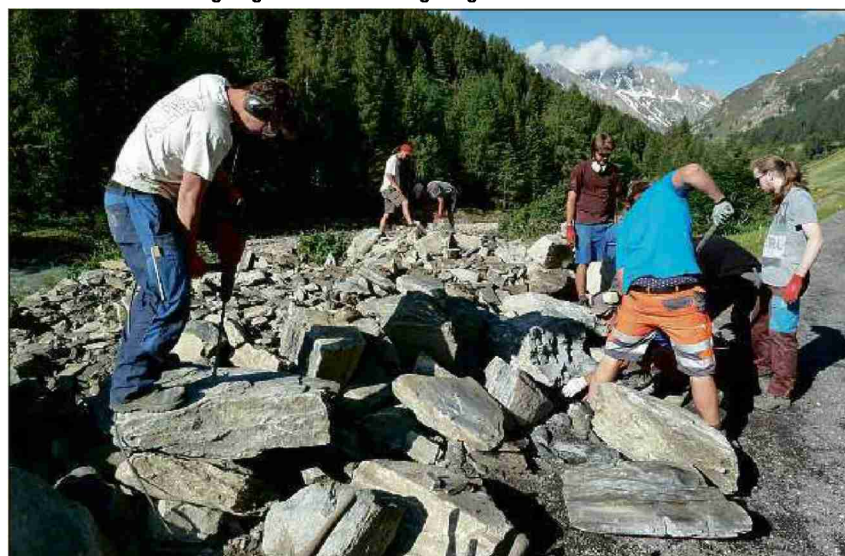
A la riva dal Schergenbach in Samignun vain la crappa preparada.