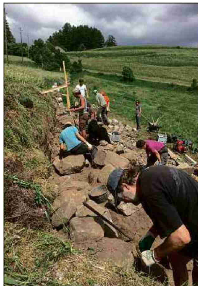
Insembel vegnan rodlets ils craps sur Ardez fin chi sun al dret lö.