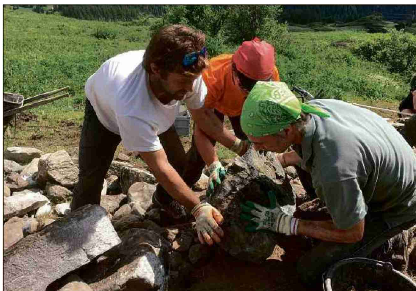
Cun tender cordas vegna guardà cha'l mür gnia gualiv.

Referenz: 69903911 Ausschnitt Seite: 4/5