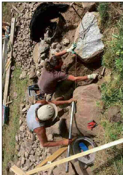
Eir ün chan es ad Ardez da la partida.