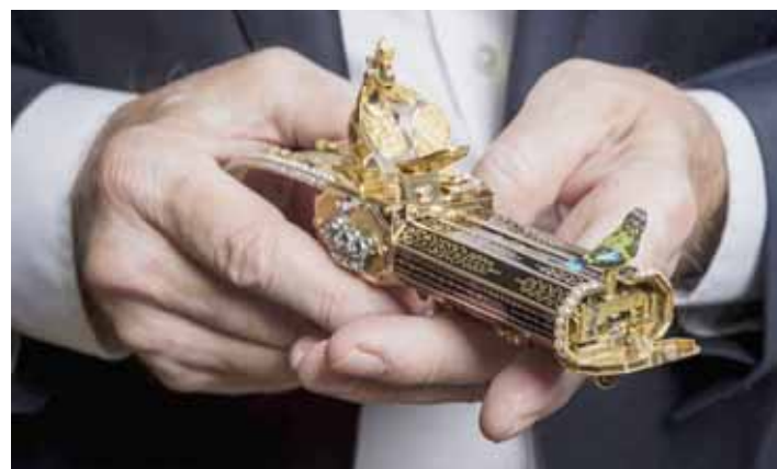
Démonstration d'un pistolet à l'oiseau chanteur.