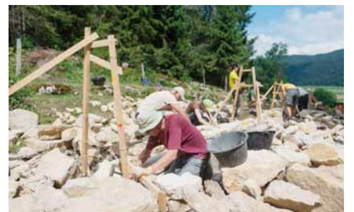
Reconstruction d'un mur en pierres sèches à La Sagne. LUCAS VUITEL