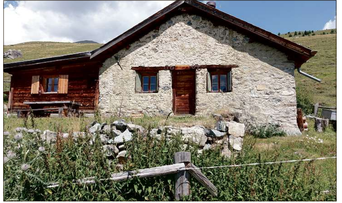
Ils mürs sechs intuorn la tea dal prümaran Prà San Flurin sün Telf pro Sent vegnan refats.