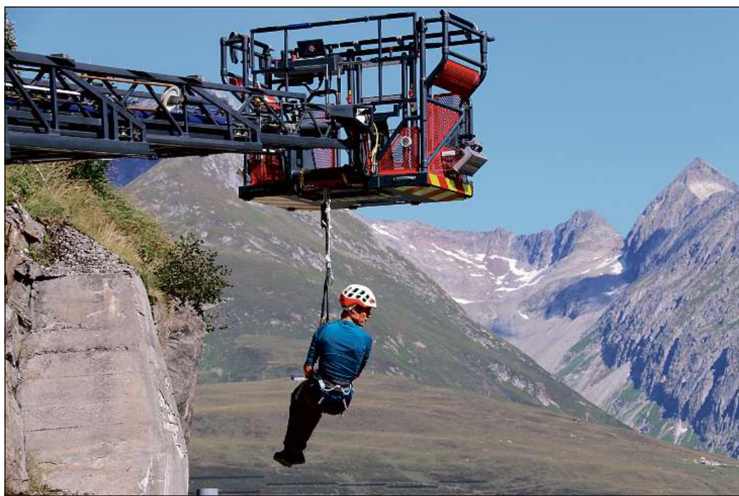
Denter auter ein las pussevladads che seperschan cugl autoscala dils Pumpiers Sursassiala vegnidas examinadas.

Gest aschi impurtont sco da fixar finamiras e prioritads ei denton era da controlar schebein quellas vegnan lu era efectivamein ademplitas. Quei ei da niev l'incumbensa dalla cumissiun parlamentara per strategia e politica statala. Sin fundament dallas experiences fatgas ha la cumissiun elaborau en dialog culla regenza 14 directives empalontas per la perioda 2021–2024 che vegnan discutadas ier ed oz aspramein el plenum dil cussegl grond.