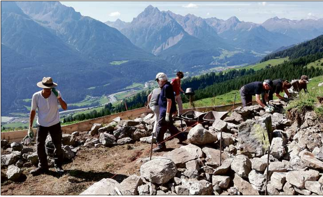
Ils voluntaris vi da la refacziun d'ün mür sech.