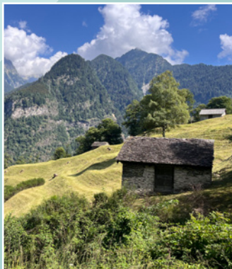
Semaine entretien de la nature