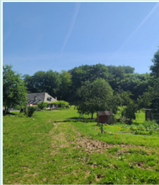
Semaine entretien de la nature