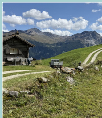
Semaine mur de pierres sèches