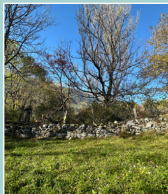
Semaine mur de pierres sèches