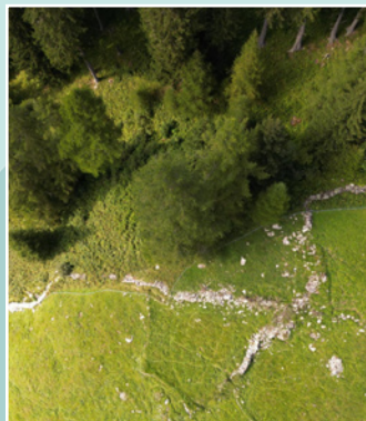
Semaine mur de pierres sèches