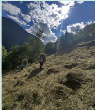
Semaine entretien de la nature