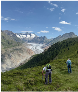
Semaine entretien de la nature

* En raison des coûts inhérents au type d'hébergement, nous ne pouvons accorder aucune réduction pour cette semaine.