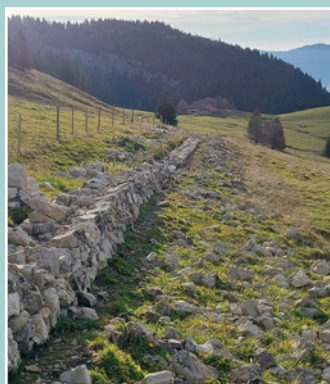
Semaine mur de pierres sèches