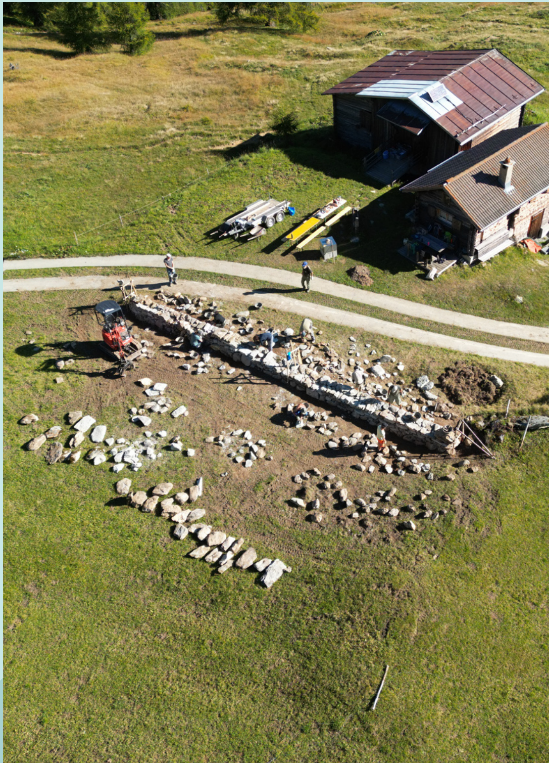
Chantier mur de pierres sèches 2025 à Dumagns, Val Schons, Grisons.