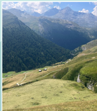
Semaine entretien de la nature