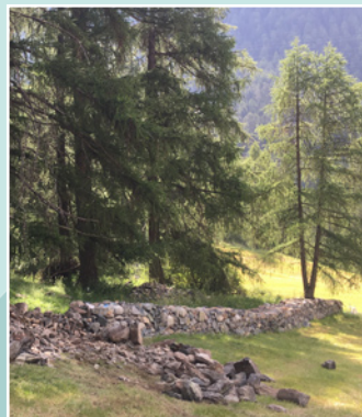
Semaine mur de pierres sèches