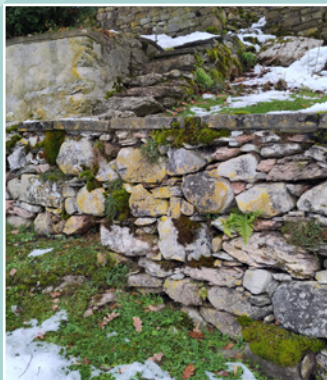
Semaine mur de pierres sèches