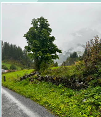
Semaine mur de pierres sèches