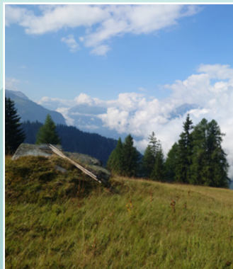
Semaine entretien de la nature