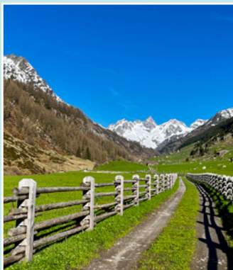
Semaine entretien de la nature