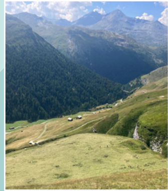
Semaine entretien de la nature