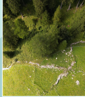
Semaine mur de pierres sèches